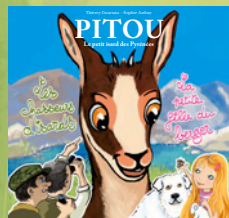
Pitou, le petit isard ».

Pour chaque enfant, gentiment assis les yeux grands ouverts, ce livre merveilleux constitue un véritable cadeau qui suscitera enthousiasme et enchantement en écoutant attentivement ses parents lui lire et relire l'histoire de «